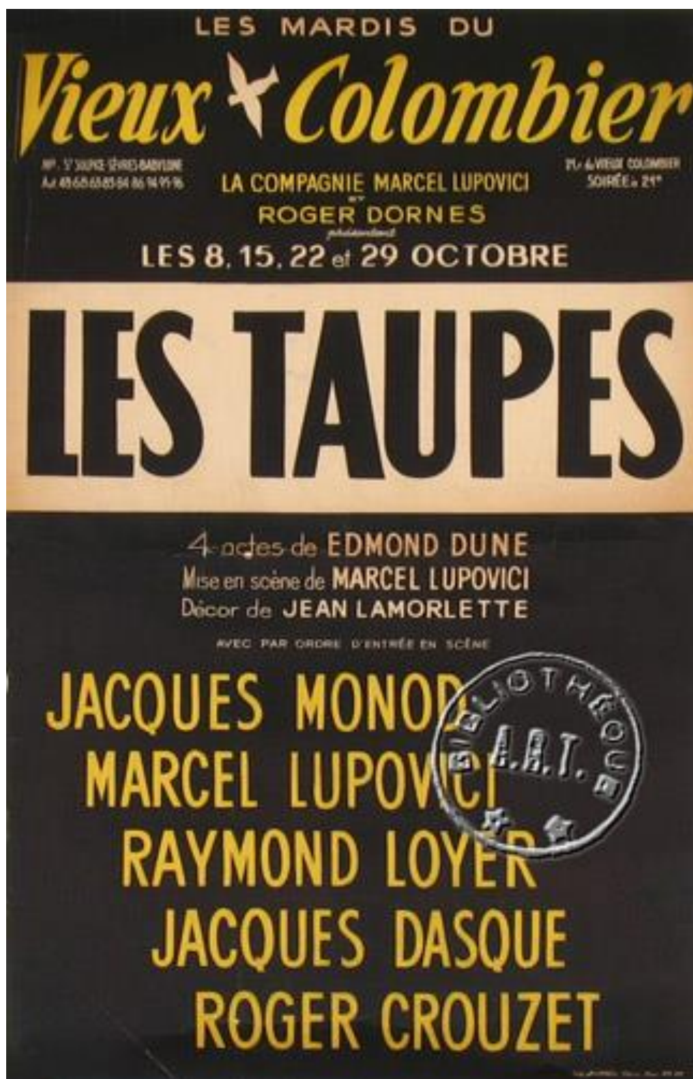
Affiche des Taupes, Théâtre du Vieux Colombier, Paris, octobre 1957