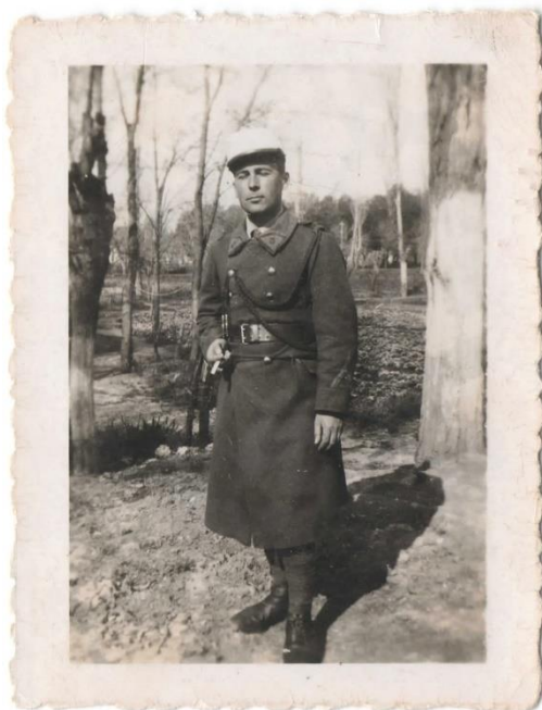
E. Dune légionnaire, non datée