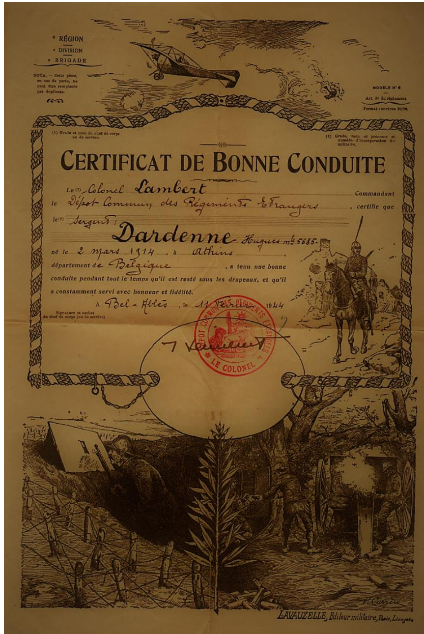
Certificat de bonne conduite de la Légion étrangère